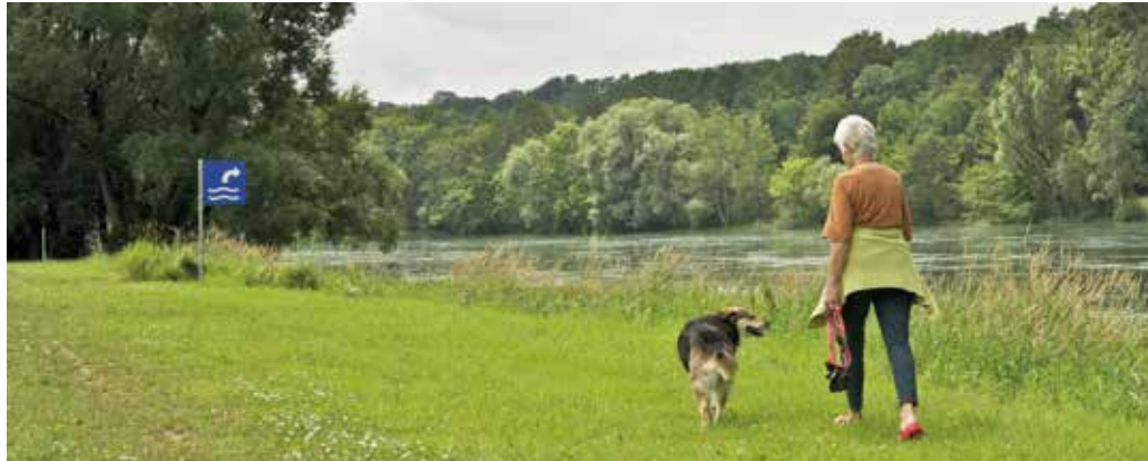
[a] Erholungszone am Rhein