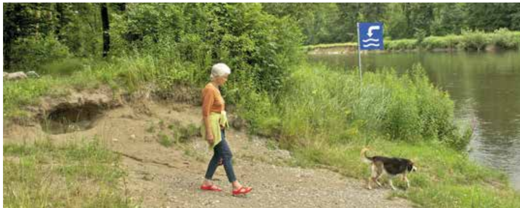
[b] Erholungszone Ellikerbrücke