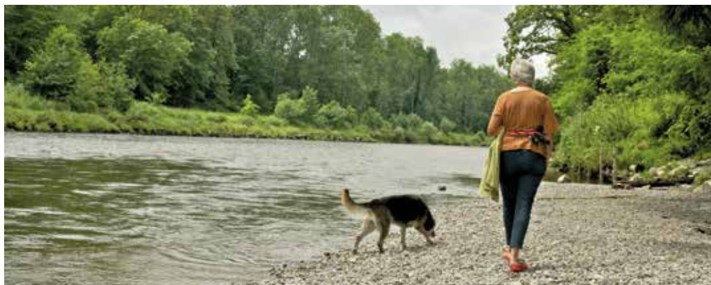
[c] Erholungszone Eggrank