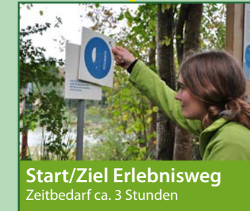
Start/Ziel Erlebnisweg Zeitbedarf ca. 3 Stunden