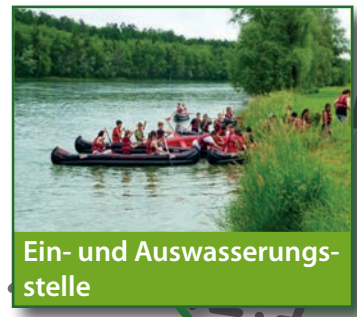
Ein- und Auswasserungs- stelle