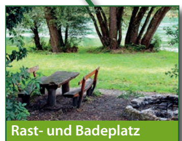
Rast- und Badeplatz